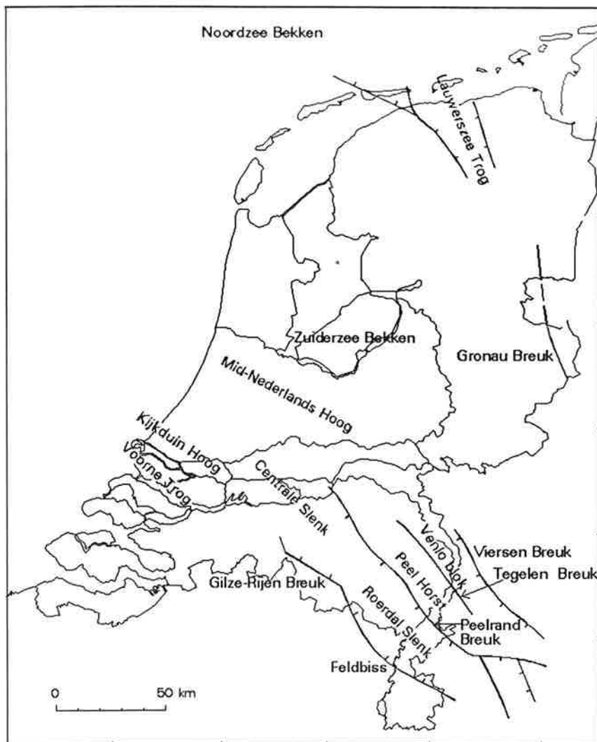
Figuur 3 - Ligging van de in dit rapport aangehaalde structurele eenheden

In de tekst wordt verwezen naar een aantal structurele eenheden in de Nederlandse ondergrond. Hiermee worden gebieden bedoeld die opgeheven of gedaald zijn. De opheffing of daling kan in een ver geologisch verleden hebben plaats gehad en nu geen rol meer spelen. Bij het karteren van de laagpakketten moet met deze opheffings- en dalingsgeschiedenis van de Nederlandse ondergrond wel rekening gehouden worden. Zo zullen na een opheffingsfase de gesteenten in het opgeheven gebied bloot komen te staan aan verwering terwijl in de dalingsgebieden dikke pakketten sediment afgezet worden. De ligging van de belangrijkste opheffings- en dalingsgebieden die ook in de tekst aan de orde komen wordt in figuur 3 weergegeven.